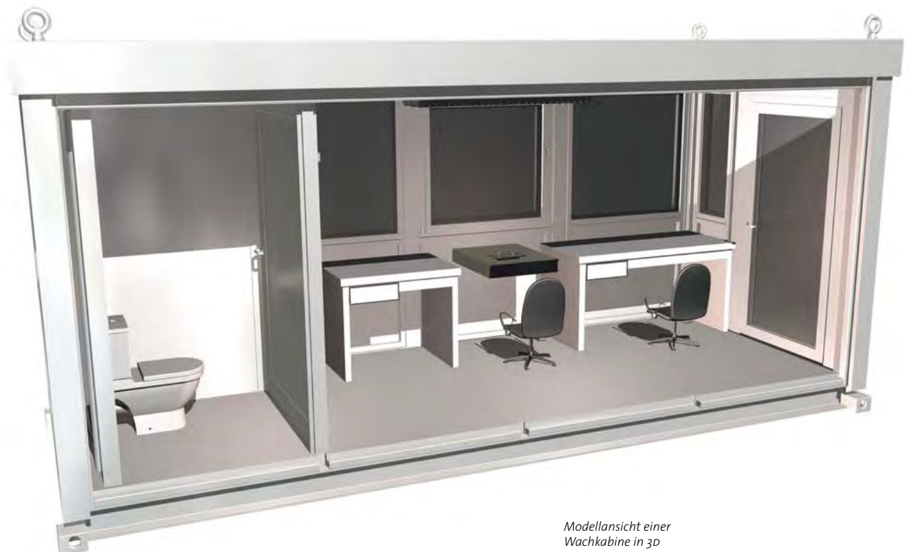
Modellansicht einer Wachkabine in 3D